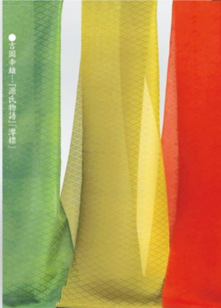
●吉岡幸雄：「源氏物語」浮織